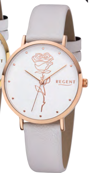
BA-624 Metall IPR, 3 Bar UVP 49,90 €