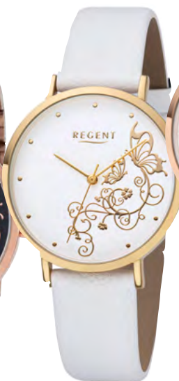
BA-615 Metall IPG, 3 Bar UVP 49,90 €