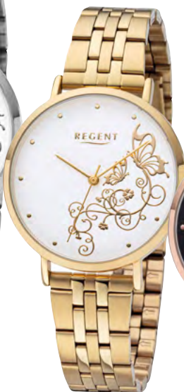
BA-611 Metall IPG, 3 Bar UVP 69,90 €