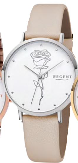
BA-622 Metall IPS, 3 Bar UVP 49,90 €