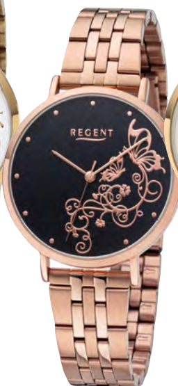
BA-613 Metall IPR, 3 Bar UVP 69,90 €