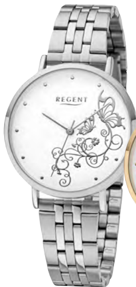
BA-610 Metall IPS, 3 Bar UVP 59,90 €