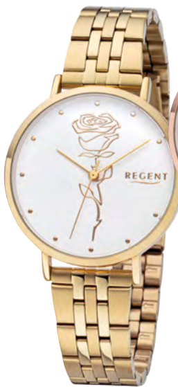
BA-619 Metall IPG, 3 Bar UVP 69,90 €