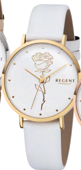
BA-623 Metall IPG, 3 Bar UVP 49,90 €