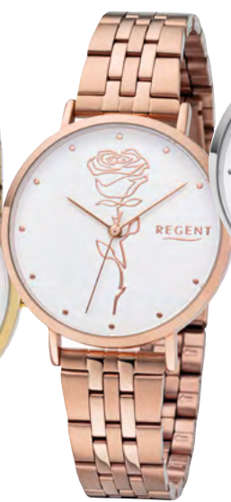
BA-620 Metall IPR, 3 Bar UVP 69,90 €