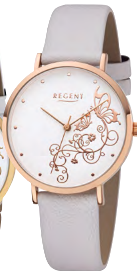
BA-616 Metall IPR, 3 Bar UVP 49,90 €