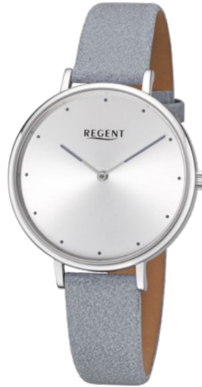
BA-450 Edelstahl, 3 Bar UVP 69,90 €