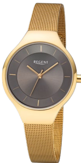
BA-456 Edelstahl IPG, 3 Bar UVP 99,00 €