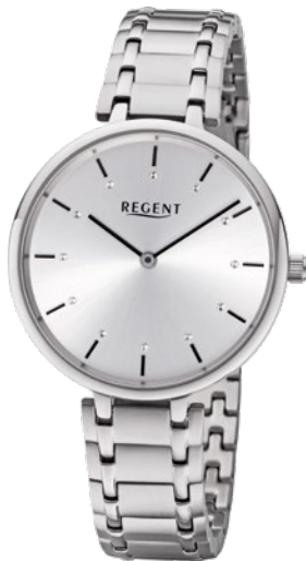
BA-462 Edelstahl, 3 Bar UVP 118,00 €