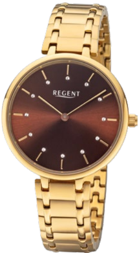
BA-464 Edelstahl IPG, 3 Bar UVP 138,00 €