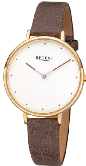
BA-453 Edelstahl IPG, 3 Bar UVP 79,90 €