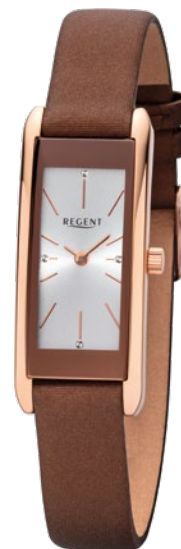
BA-461 Edelstahl IPR, 3 Bar UVP 99,00 €