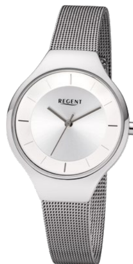
BA-454 Edelstahl, 3 Bar UVP 89,90 €