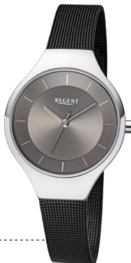
BA-455 Edelstahl, 3 Bar UVP 89,90 €