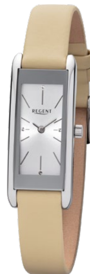
BA-458 Edelstahl, 3 Bar UVP 89,90 €