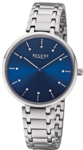
BA-463 Edelstahl, 3 Bar UVP 118,00 €