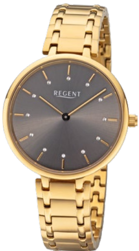
BA-465 Edelstahl IPG, 3 Bar UVP 138,00 €