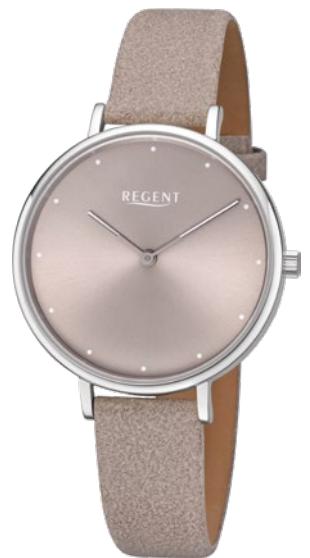
BA-451 Edelstahl, 3 Bar UVP 69,90 €