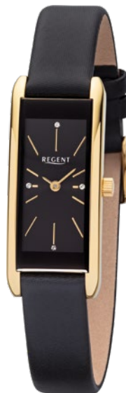
BA-460 Edelstahl IPG, 3 Bar UVP 99,00 €