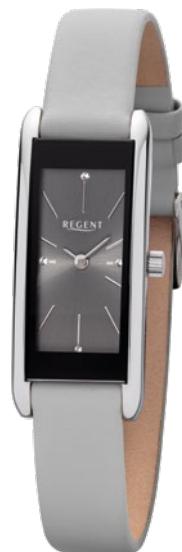
BA-459 Edelstahl, 3 Bar UVP 89,90 €