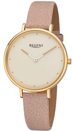
BA-452 Edelstahl IPG, 3 Bar UVP 79,90 €