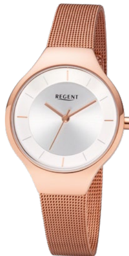
BA-457 Edelstahl IPR, 3 Bar UVP 99,00 €